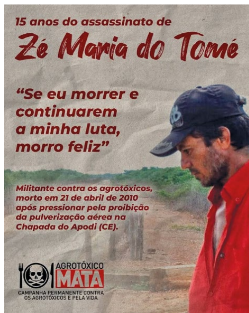
Figura 3 - Cartaz da XIV Semana Zé Maria do Tomé.