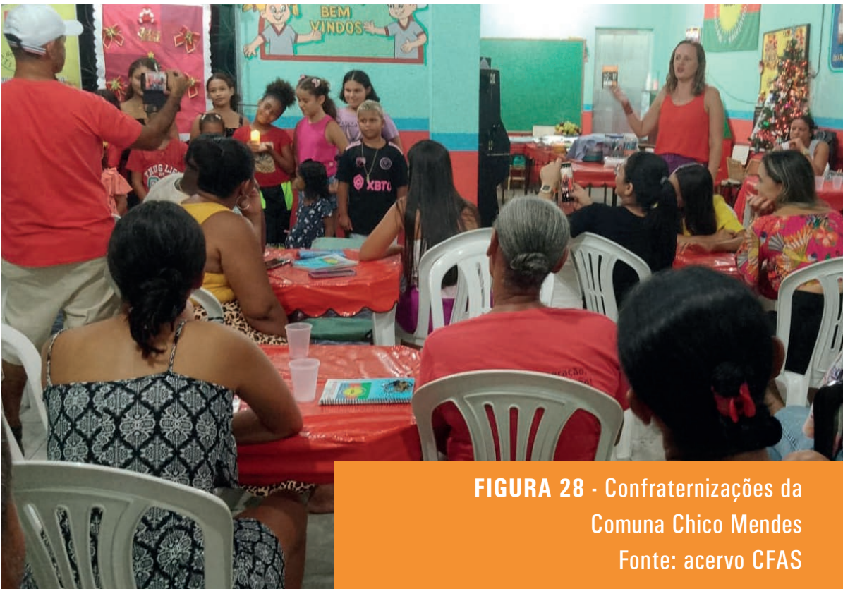
FIGURA 28 - Confraternizações da Comuna Chico Mendes