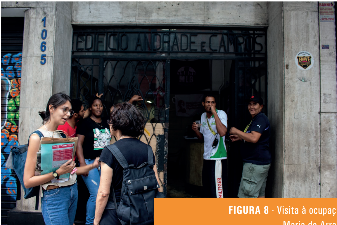
FIGURA 8 - Visita à ocupação Maria do Arraial