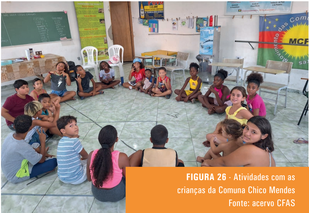
FIGURA 26 - Atividades com as crianças da Comuna Chico Mendes