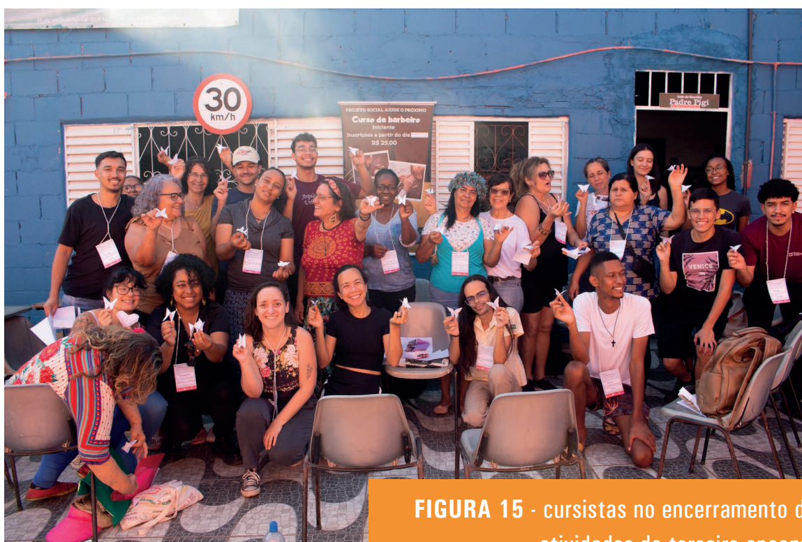
FIGURA 15 - cursistas no encerramento das atividades do terceiro encontro