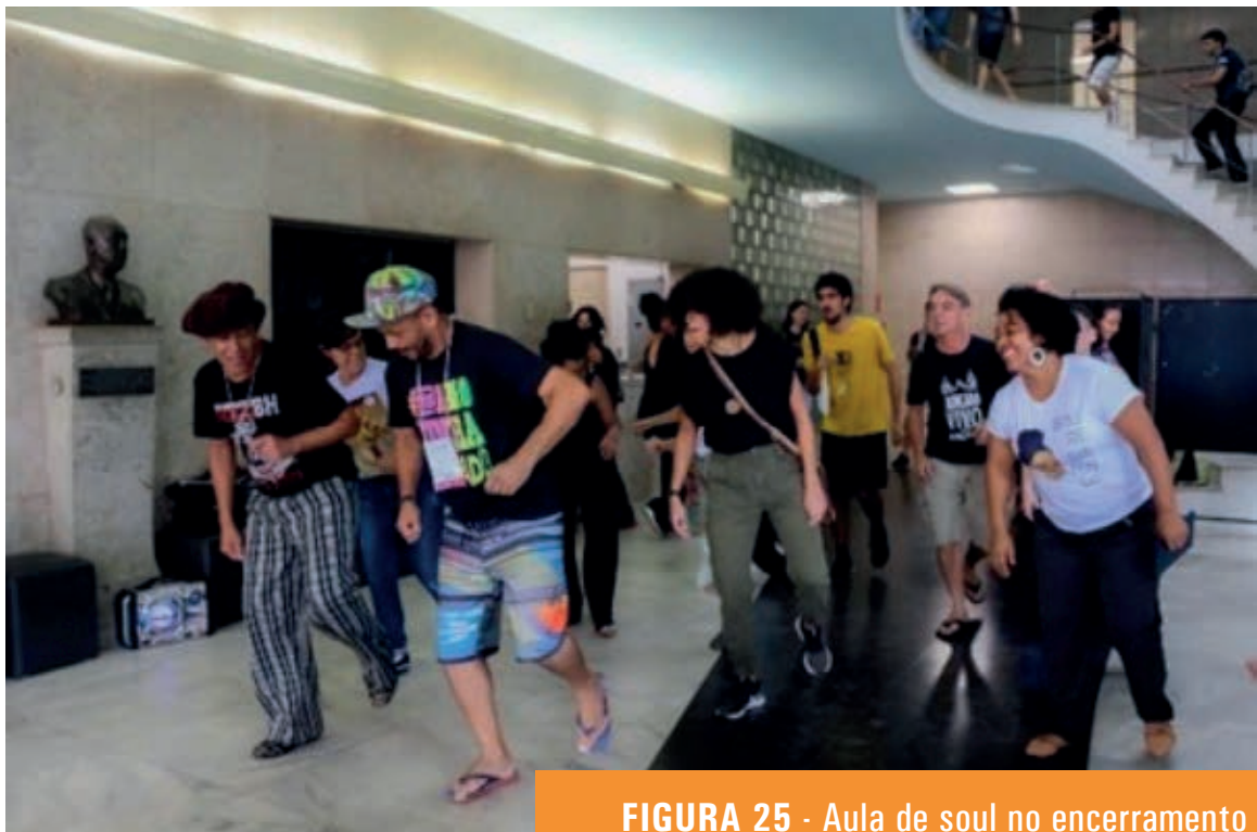
FIGURA 25 - Aula de soul no encerramento do curso, no hall da Escola de Arquitetura da UFMG