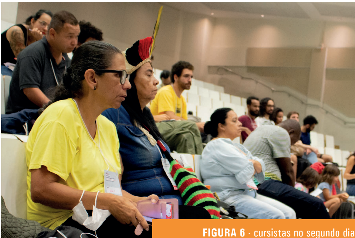
FIGURA 6 - cursistas no segundo dia de encontro, no CRJ