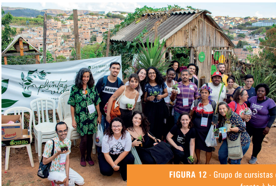
FIGURA 12 - Grupo de cursistas em frente à horta

O quarto dia de encontro do CFAS foi dedicado ao tema “Transição ecológica, risco socioambiental e gestão do lixo urbano” . Ele foi sediado na sede da Pastoral Metropolitana dos Sem Casa, também conhecida como Núcleo CEPROVM, localizada no bairro Vila Mariquinhas, na região norte de Belo Horizonte.