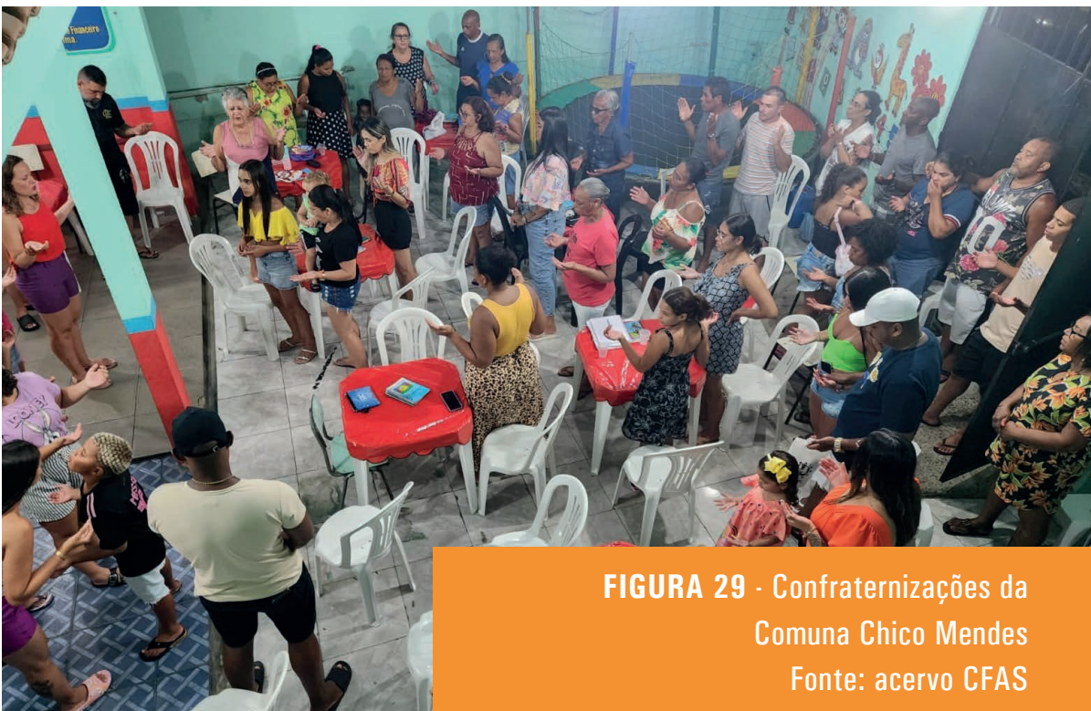
FIGURA 29 - Confraternizações da Comuna Chico Mendes