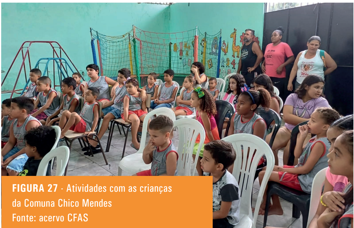
FIGURA 27 - Atividades com as crianças da Comuna Chico Mendes