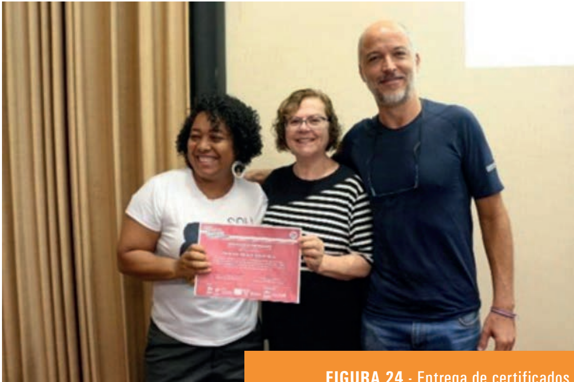
FIGURA 24 - Entrega de certificados