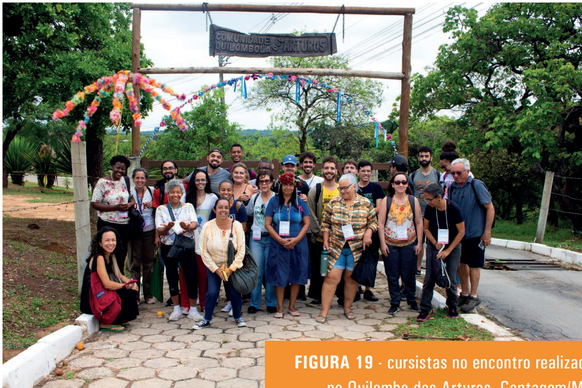
FIGURA 19 - cursistas no encontro realizado no Quilombo dos Arturos, Contagem/MG