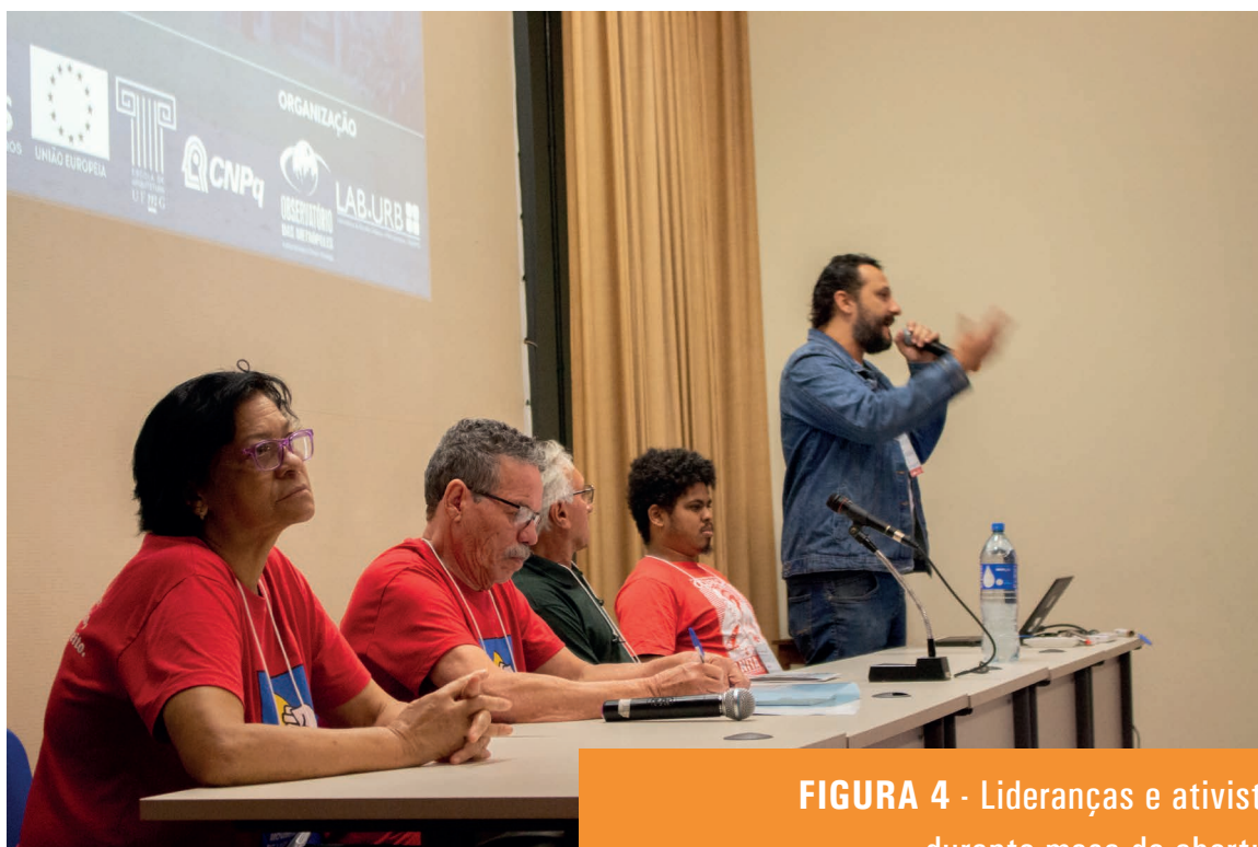
FIGURA 4 - Lideranças e ativistas durante mesa de abertura