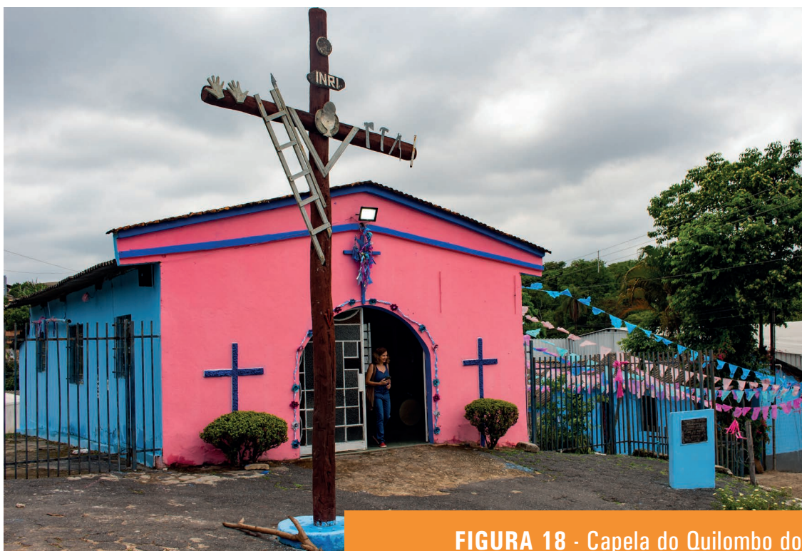
FIGURA 18 - Capela do Quilombo dos Arturos, Contagem/MG

No encontro seguinte, sessão de encerramento, um representante do grupo se encarregaria de apresentar a síntese dessas proposições.