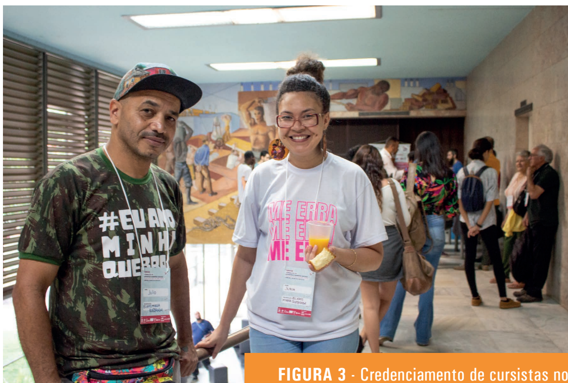
FIGURA 3 - Credenciamento de cursistas no hall do auditório da EA UFMG