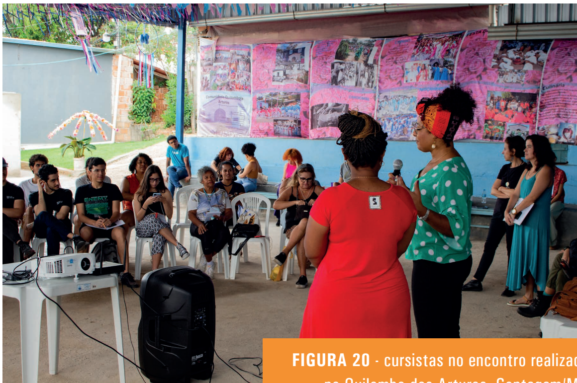
FIGURA 20 - cursistas no encontro realizado no Quilombo dos Arturos, Contagem/MG