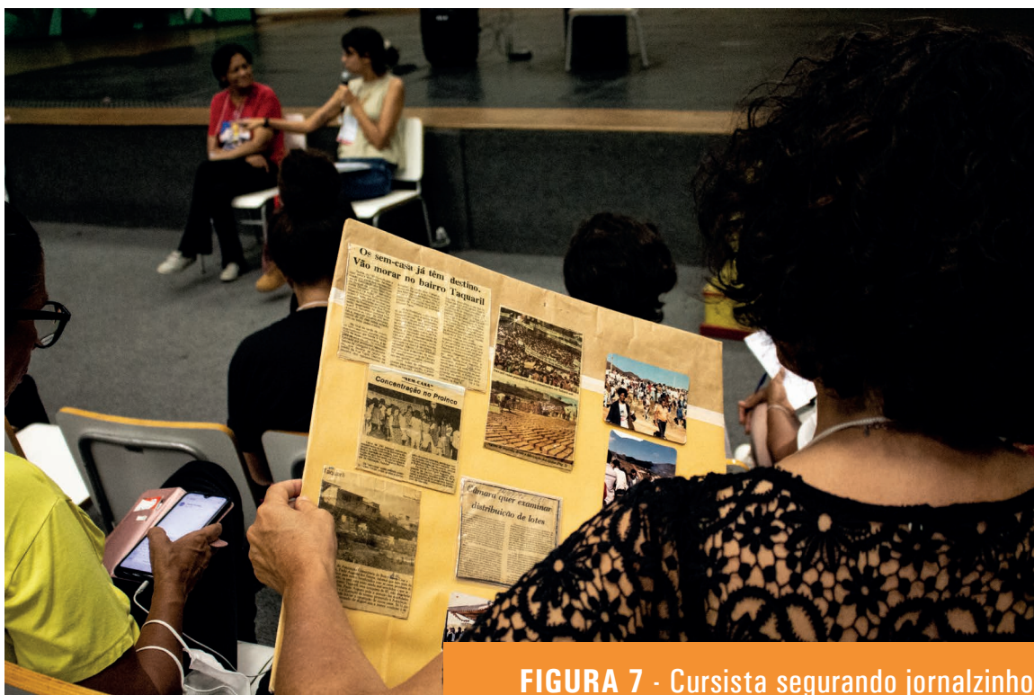
FIGURA 7 - Cursista segurando jornalzinho histórico sobre a luta do Taquaril em BH